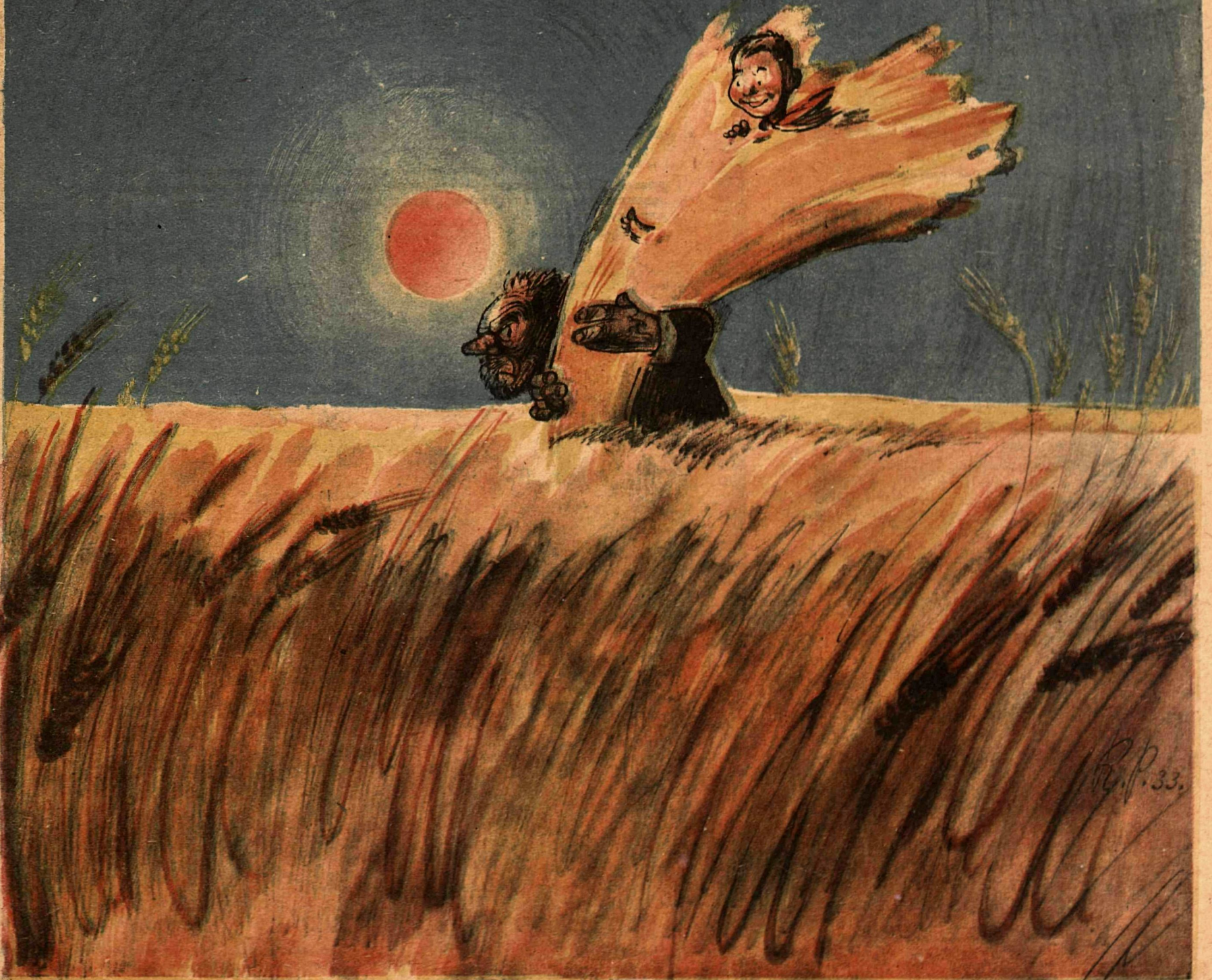
Рис. К. Рогова (тема Я. Бельского и М. Глушкова)

ПИОНЕР: — Ну, теперь уж я его доставлю, куда следует!..