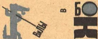
Рис. Ю. Ганфа (тема Бен-Гали и Ю. Ганфа)